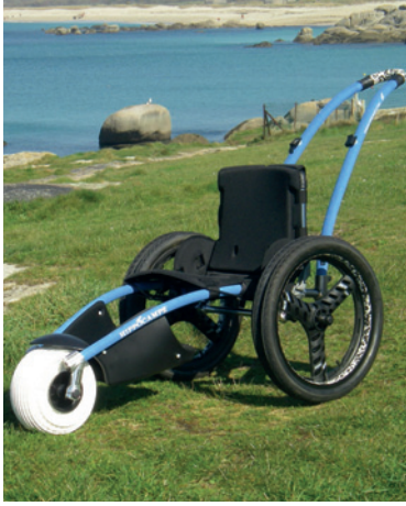
L'Hippocampe® est une aide technique qui permet de se baigner et de se promener sur des sentiers avec un accompagnateur.

Maisons départementales des personnes handicapées (MDPH). Plusieurs organismes (associations locales ou nationales...) proposent