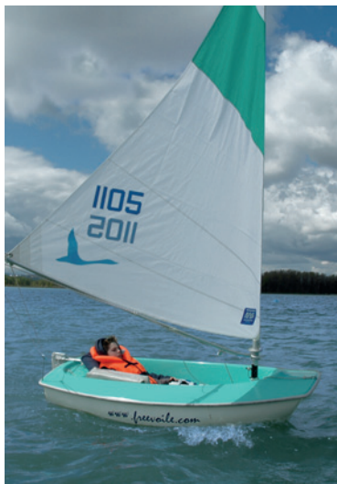
Des bateaux adaptés aux personnes en situation de handicap permettent de pratiquer la voile.

En bord de mer , de nombreuses plages sont accessibles. Pour se baigner, les vacanciers en situation de handicap peuvent